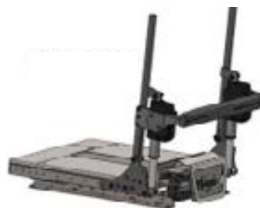
Dossier électrique 0° - 160°