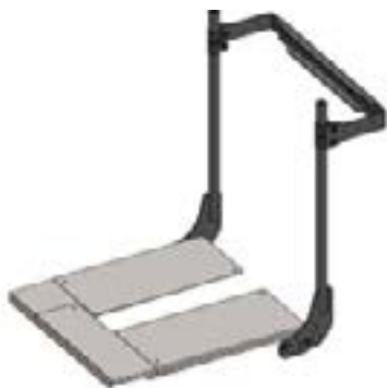
Système d'assise REHAB, cadre de dossier Rehab