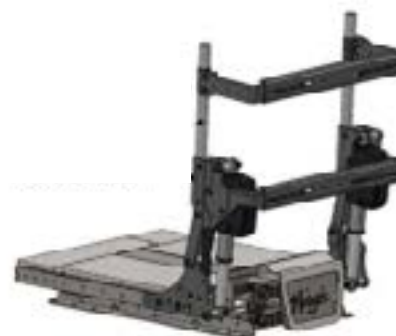
Dossier électrique à compensation 0° - 155°